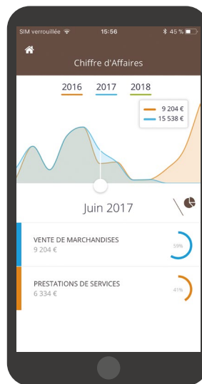
Aperçu en version mobile